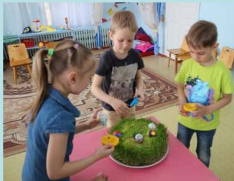
Игра «Прокати яйцо»