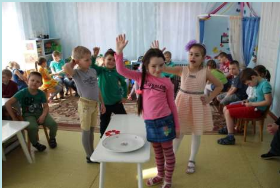
Игра «Катись, катись яичко»

Интересная и эффективная форма работы это организация народных игр, где дети приобщаются к национальной культуре, посредством формирования интереса к традициям празднования христианского праздника «Пасха. Светлое Христово Воскресение».